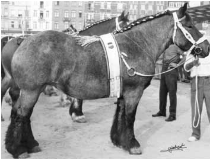
Ninon de Forestaille - Championne belge 1961 Belgisch kampioene